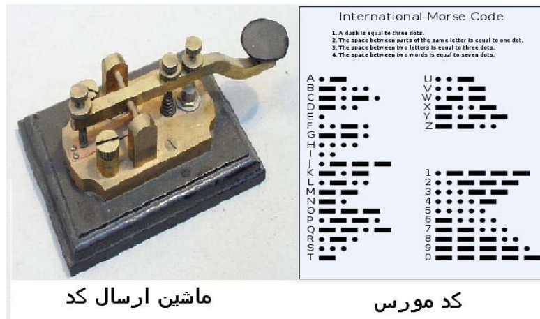
ماشین ارسال کد

۱۹۰۸ عملاً اجرا گردید. SOS تا سال ۱۹۹۹ به عنوان علامت درخواست کمک در ارتباطات بی سیم دریایی مورد استفاده قرار می گرفت، تا اینکه سیستم امنیتی جهانی درخواست کمک دریایی جایگزین آن شد. هنوز هم SOS به عنوان نشان دیداری (بصری) درخواست کمک شناخته می شود. در ابتدا این علامت شامل توالی مداوم "سه نقطه/سه خط تیره/سه نقطه" (...---...) بوده که همگی با هم و بدون هیچگونه فاصله اجرامی شدند. در کد بین المللی مورس سه نقطه نماینده حرف S و سه خط تیره نماینده حرف O است.